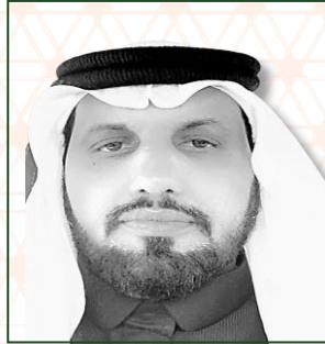
عضو مجلس ادارة