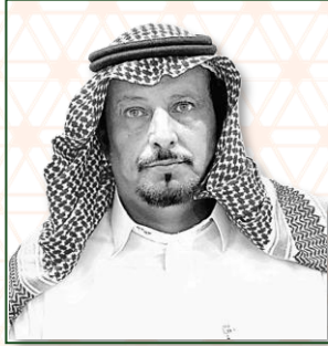
عضو مجلس ادارة