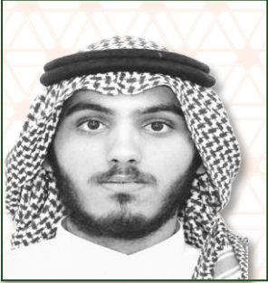
عضو مجلس ادارة