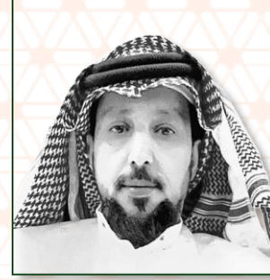
نائب رئيس مجلس الادارة